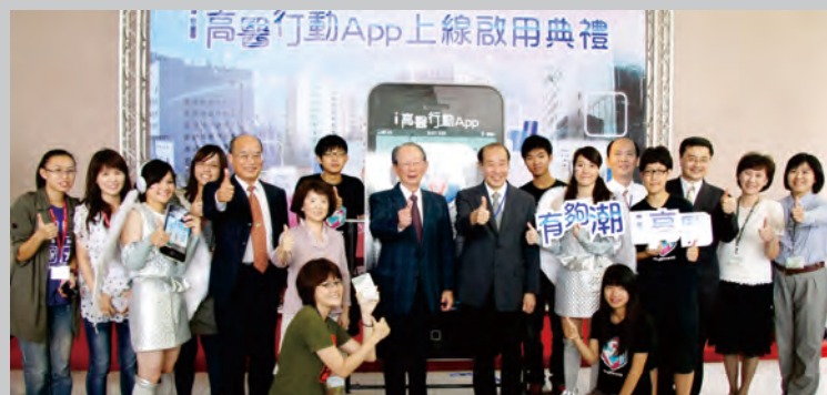
100年10月13日圖書館舉辦「i高醫」行動APP上線啟用典禮